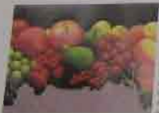
Con el periodo de hoy se oferta un kilo de compra por un kilo de fruta a elegir

Quedan invitados todos aquellos a los que les guste "la buena fruta"