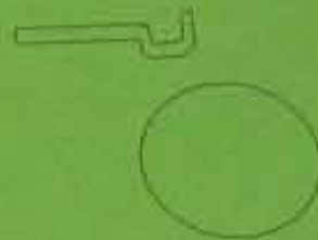
ARO Y PALO